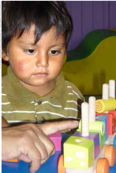
Oben: Anregung in einem Projekt zur Stärkung der Kinderrechte in Pachacútec, Peru.