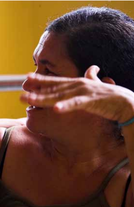
Mutter und Sohn im Projekt Cervac. In diesem Projekt in der brasilianischen Großstadt Recife engagieren sich die Eltern behinderter Mädchen und Jungen. Die Kinder erhalten hier gezielte Unterstützung und Förderung.

wichtige Phase der frühkindlichen körperlichen Entwicklung des Kindes, die untrennbar mit der Gesundheit der Mutter verbunden ist, sowie über die kognitive Entwicklung des Kindes, die durch Stimulation und Frühförderung gezielt unterstützt werden kann.