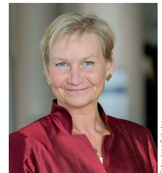
Bischöfin Kirsten Fehrs Amtierende Ratsvorsitzende der EKD

Wenn ich alles prüfe und das Gute behalten will, dann ist es am Ende doch diese Hoffnung und die Kraft der Hoffnung, die ich mir behalten will, die ich mir und allen ehren- und hauptamtlichen Mitarbeitenden erhalten will, die sich weltweit für Kinder in Not einsetzen. Dieses hoffnungsvolle Vertrauen möge uns auch im Jahr 2025 begleiten und tragen.