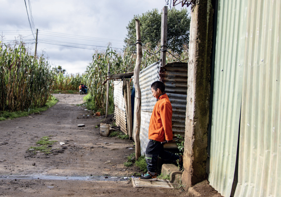
> Juans Familie lebt in einer Wellblechhütte Fotos und Text: Martin Bondzio